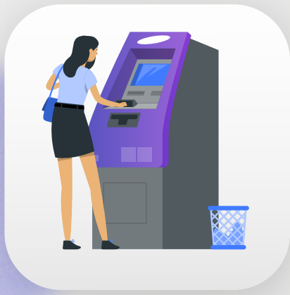
Clave de Cajero Automático.